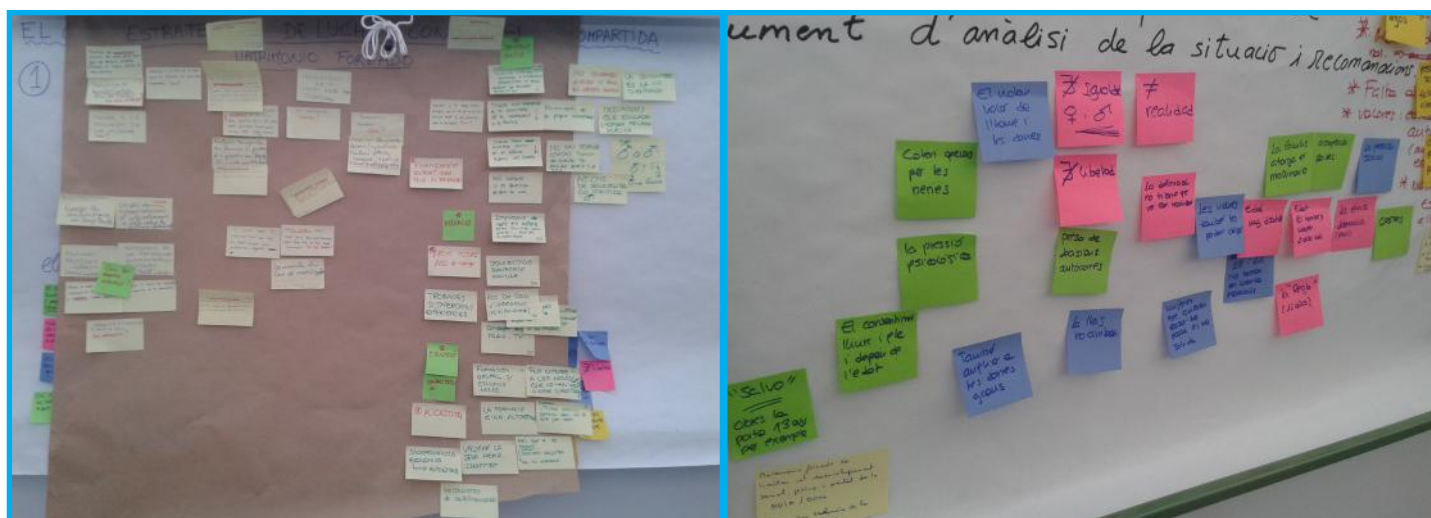
Durant el taller del 13 i 14 d'abril de 2016: procés de coconstrucció de conclusions.

Les Jornades de Treball es desenvoluparen a mode de Focus Group , posant èmfasi en la interacció grupal, esdevenint una ocasió per a què les participants aprenguin les unes de les altres, en un context permissiu i de llibertat d'expressió. Per a poder mantenir aquest clima interactiu, es va optar per combinar el debat amb dinàmiques de grup i treball participatiu per parelles, utilitzant materials diversos que permetessin la col·laboració directa de les dones presents a les Jornades.